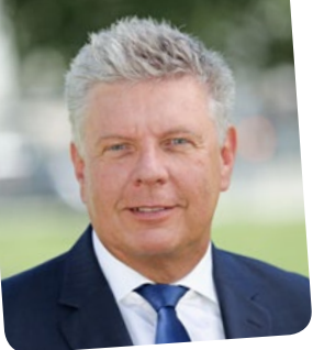
Dieter Reiter Oberbürgermeister der Landeshauptstadt München